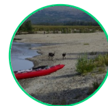
2 горы Полярного Урала Ямало-Ненецкий автономный округ