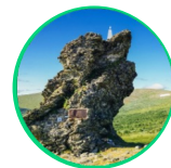
1 перевал Дятлова Свердловская область